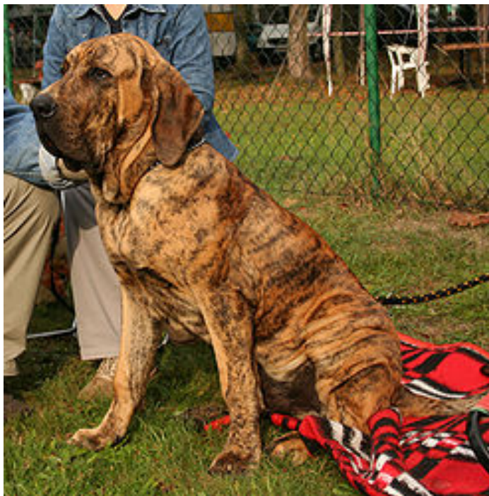
Бразильский фила, фила бразилейро — крупная рабочая порода собак, выведенная в Бразилии

промыть рану, обработать края йодом, наложить чистую повязку; выяснить, привита ли собака от бешенства; обратиться в травмпункт.