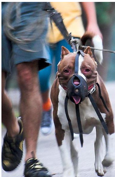
Собака породы «питбультерьер» в наморднике

Если вблизи имеется укрытие или дерево, медленно отступай к нему спиной, не делая резких движений.